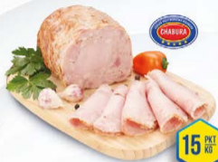
016-2061 PIECZEŃ Z POLĘDWICZKA