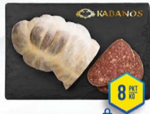
037-2127 KASZANKA PIECZONA 2,5