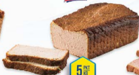
135-2004 PASZTET INDYKPOL 4 KG