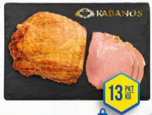
037-2172 SZYNKA PYZDRY 1,1