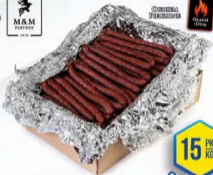
371-0087 KABANOS Z OGNIA NA CIEPŁO 3,2