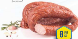
371-0110 KIELBASA ZE WSI 1,5