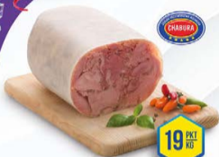
016-2076 SALCESON Z INDYKA