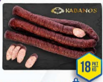
037-2171 KIEŁBASA DLA CHŁOPA 1,8