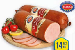
016-2044 KRAKOWSKA PARZONA