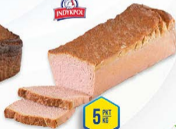
135-4223 PASZTET INDYKPOL 2 KG