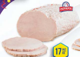
135-4398 ALBA FILET GOTOWANY Z INDYKA