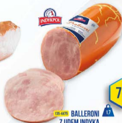
135-4475 BALLERONI Z UDEM INDYKA