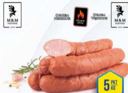
371-0109 PODWAWELSKA Z OGNIA 1,1