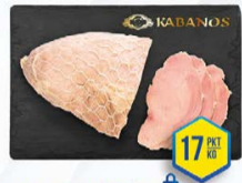
037-2267 SZYNKA ŚNIEŻNA 2