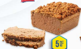
135-4478 PASZTET Z KRUSZONKĄ