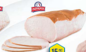
135-2003 FILET SPECJAŁ