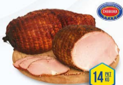
016-3138 SZYŃKA OD GÓRALI