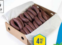
371-0081 KASZANKA Z PIECA 3,2