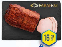
037-2476 SCHAB NIE ZE WSI 2