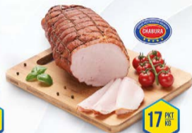
016-3121 SZYŃKA RZEŹNIKA