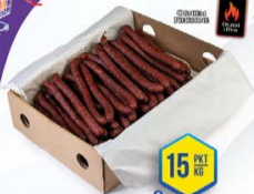
371-0054 KABANOS Z OGNIA 3,2