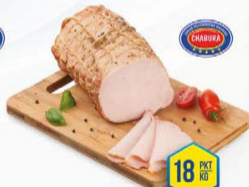
016-3144 SZYŃKA MAGNACKA W POSYPCE