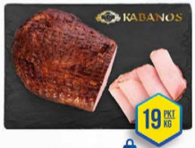
037-2125 SZYNKA BACY 1,5